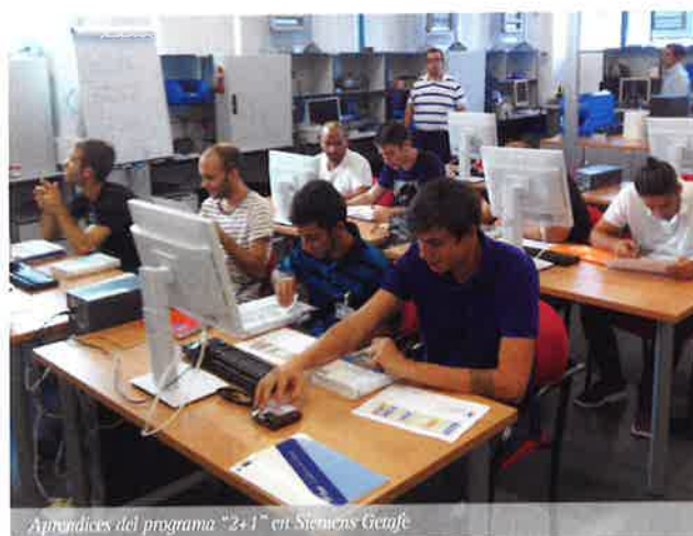
Aprendices del programa "2+1" en Siemens Getafe

A través de la Cámara Alemana y la FEDA los aprendices consiguen, además, y superando los exámenes según el modelo alemán, la titulación alemana y con ello la doble titulación. El proyecto cuenta con