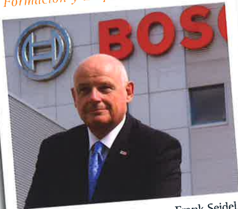
Entrevista con Frank Seidel, presidente del Grupo Bosch para España y Portugal