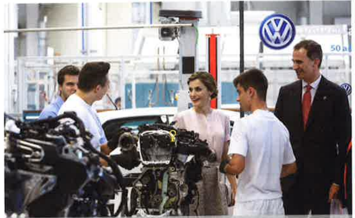
Los Reyes de España en su visita a los talleres de FP Dual en Volkswagen Navarra en Junio 2016

Este año escolar que acaba de empezar, la Cámara Alemana reanuda con buenas expectativas sus diferentes proyectos de Formación Profesional Dual. Por un lado, ya han empezado los distintos grupos de Técnicos en gestión empresarial en industria y logística/transporte, programas del Centro de Formación Profesional Dual Alemán FEDA Barcelona y Madrid, ya implantados desde hace 30 años en España. Igualmente sigue el exitoso programa de Técnico en actividades comerciales, que la FEDA empezó hace cuatro años, especialmente en cooperación con la empresa formadora Aldi. Contamos con unos 80 aprendices que empiezan su FP Dual con la FEDA este año.