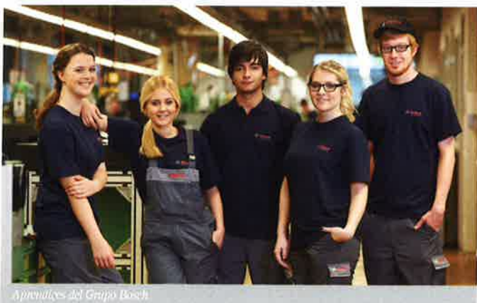
Aprendices del Grupo Bosch

Más reciente es nuestra colaboración con la Formación Profesional Dual. En varias de las comunidades en las que Bosch tiene presencia, como Galicia, Cantabria y Madrid, se están ofreciendo prácticas a estudiantes de Formación Profesional Dual de distintos ciclos.